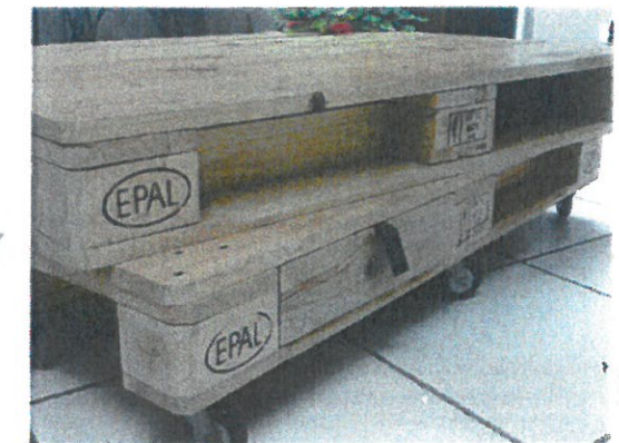
palettes, planches, bois